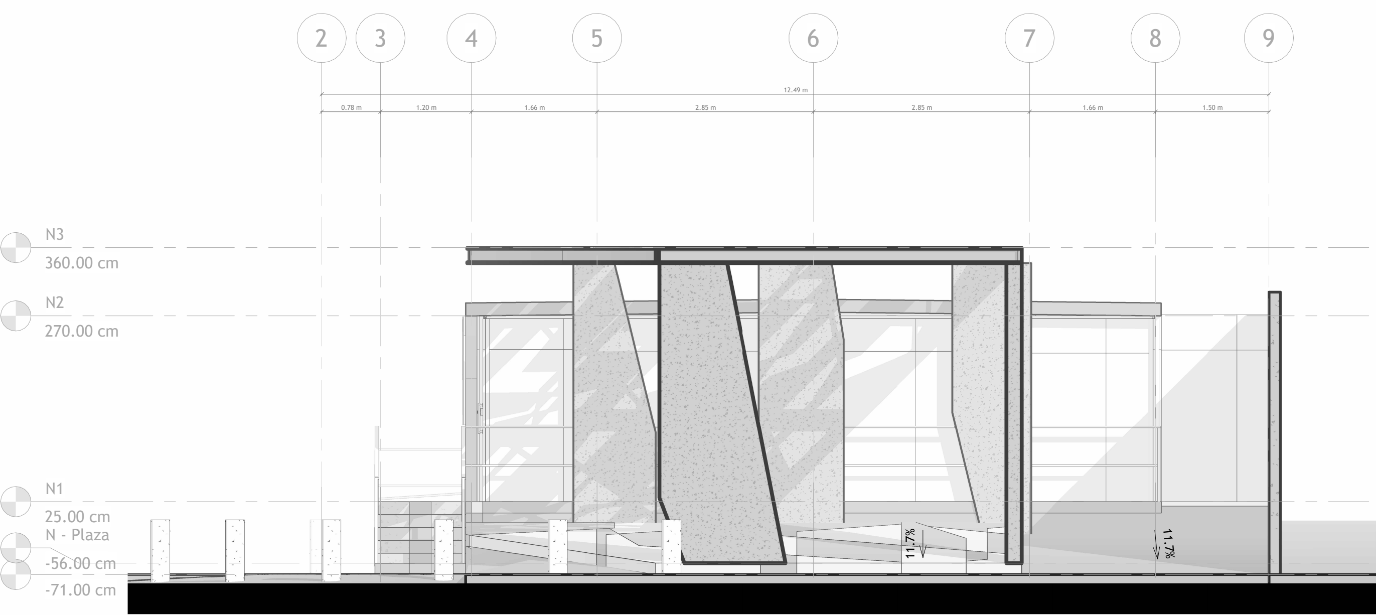
1 FACHADA FRONTAL 1 : 50