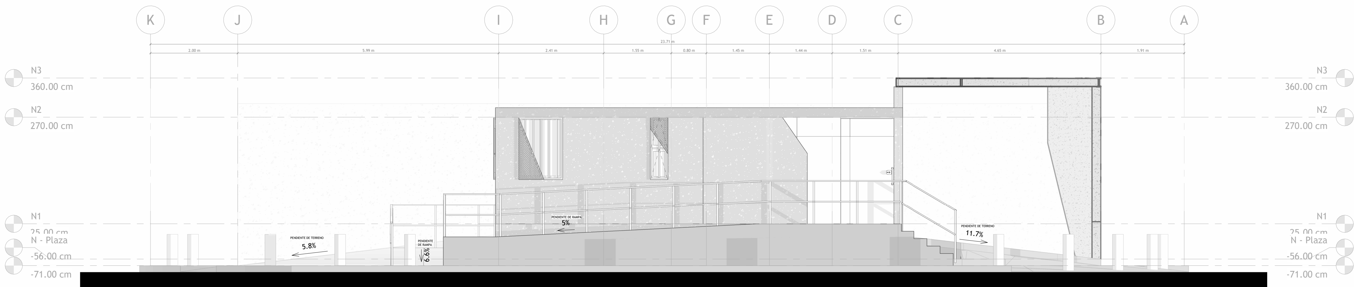
4 FACHADA LATERAL 1 : 50